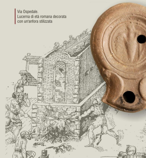
Via Ospedale. Lucerna di età romana decorata con un'anfora stilizzata

La continuità abitativa di questo settore urbano fra IV e VII secolo è testimoniata da frammenti ceramici, in associazione a un puntalino in bronzo di età longobarda. Per l'età medievale, il recupero di distanziatori impiegati per l'impilaggio del vasellame nei forni di cottura e il rinvenimento di scarti di produzione sono indizi della presenza di attività produttive.