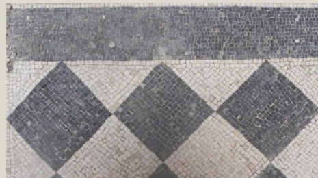
Palazzo Govone-Caratti Mosaico pavimentale bicromo a scacchiera di quadrati in tessere di marmo bianco e ardesia grigio-scuro

Un'altra pavimentazione di pregio è emersa di recente dagli scavi in Vicolo del Pozzo.