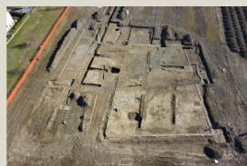
Corso Europa Foto aerea delle evidenze archeologiche emerse

Lungo Corso Europa, all'esterno del perimetro di Alba Pompeia , recenti indagini hanno messo in luce un ambiente con muri in ciottoli legati da malta, interpretabile come parte di un insediamento rustico utilizzato per lo sfruttamento agricolo delle campagne in età romana.