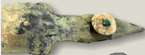
Tomba 3. Il coltellino in bronzo e osso prima del restauro (particolare); a lato disegno ricostruttivo della tomba